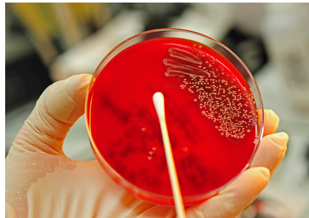
Kultivierung von Mikroorganismen auf einer Agarplatte